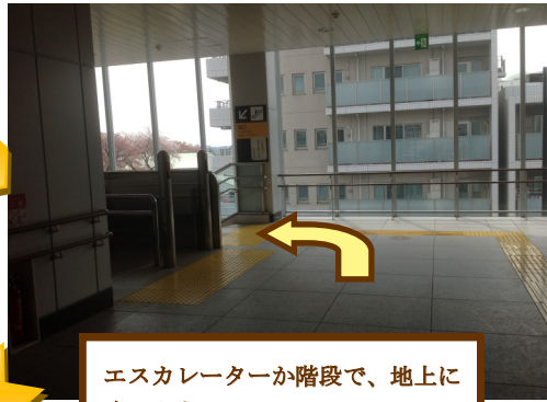
エスカレーターか階段で、地上に降ります。