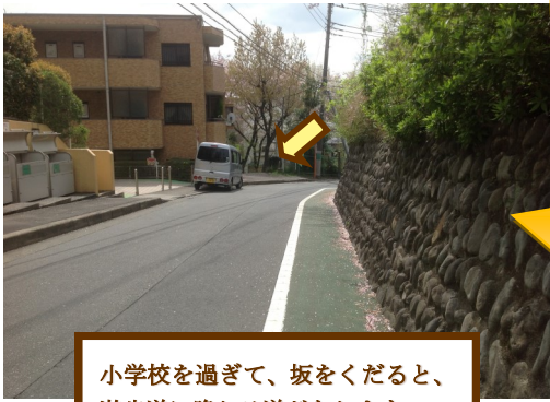
小学校を過ぎて、坂をくだると、遊歩道に降りる道があります。