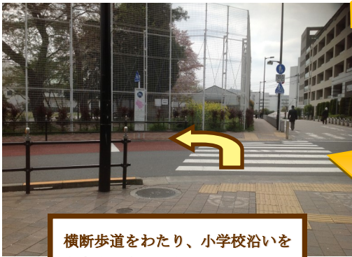
横断歩道をわたり、小学校沿いを左方向に歩きます。