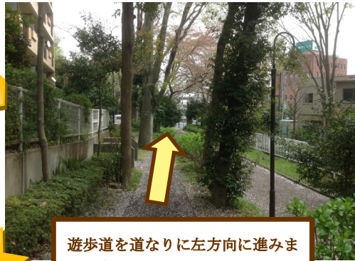
遊歩道を道なりに左方向に進みます。右手にJAが見えてきます。