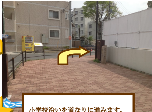
小学校沿いを道なりに進みます。