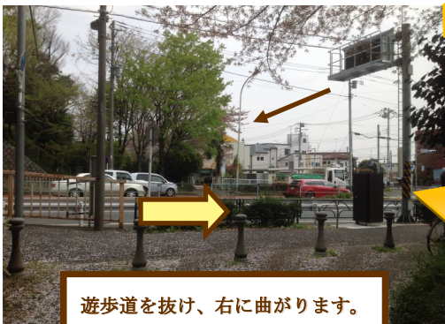
遊歩道を抜け、右に曲がります。もうすぐそこです。