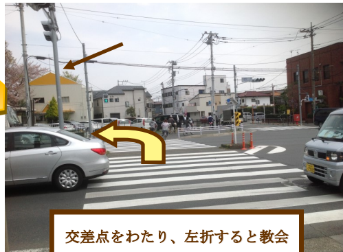
交差点をわたり、左折すると教会の入口になります。