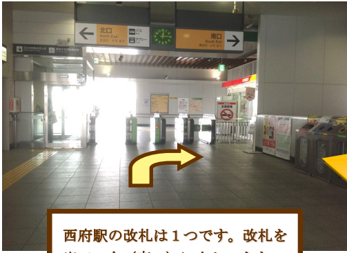
西府駅の改札は1つです。改札を出て、右（南口）に向かいます。