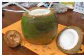
悪戦苦闘 ジュース約200cc