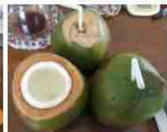
2個目、3個目と要領良く