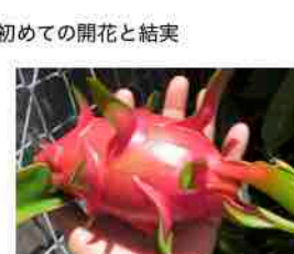
一ヶ月 大きくなり