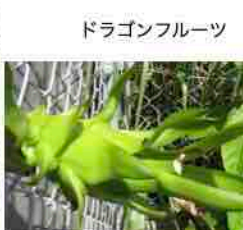
数日後 膨らみ始め