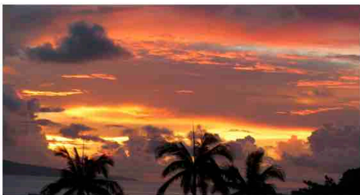
西表島の北に沈む夕日