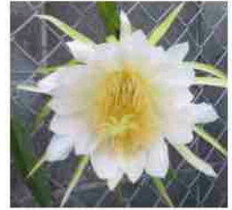
ドラゴンフルーツ(早朝) 若干元気がない