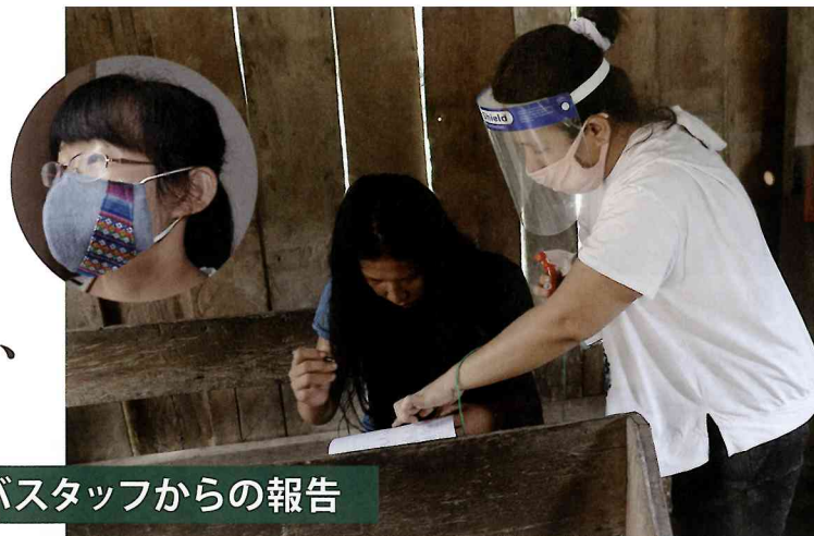
移動中のスタッフ (丸写真) ④移転後にもう一度村づくりの学びを実施 (アルサビ)

マンヤンと呼ばれているミンドロ島原住民のタウブイッド族の人たちが暮らすアルサビ村 (以前のマイ村) は、HOLPFIが関わっている地域の一つです。人々は5年前、私たちの働きを通して、自分たちの村をどんな村にしたいのかに気付きました。そして子どもたちが読み書きを学べる公立学校が欲しいという夢を持ちました。そうすれば進級して学校に通い続けることができるからです。アルサビ村は近くの村へ7.7km、歩いて2、3時間です。その村に行けば日用必需品を買うことができ、学校、ヘルスセンターがありますが、マヨ川とスندا川という2つの川を38回渡らなければなりません。子どもを学校に行かせたい、という人々の夢は叶うべくもありませんでした。