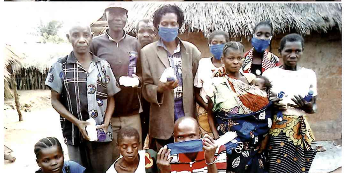
学校や村を訪れ手洗いキットの提供や感染予防の説明を行う(ブウェ)