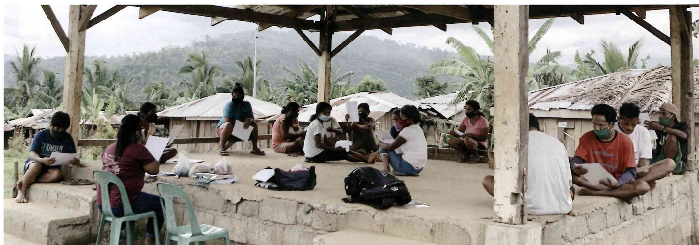
教育支援保護者会の様子 (アルサビ)

教育と共にアルサビ村の人たちは清掃、水源、健康と衛生、リーダーシップトレーニング、ファイナンスマネジメント、土地の権利取得のための勉強などに取り組んでいます。村の人たちはここ数年で自らが率先し、責任をもって一つ一つのプロジェクトに取り組むことの大切さを知ると同時に、目標達成には時間がかかること、忍耐、一致、お金、