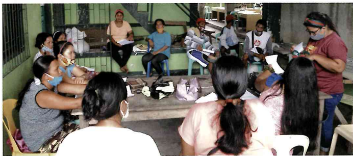
教育支援保護者会 (タガログの村)

「分かち合うことは思いやること」と言われていることは真実です。貧困の中にある若い人たちが将来の夢を達成するために学べる道を備える Blessed Education Program (神の祝福の中にある教育プログラム=略して BEP)は、フィリピン国内の支援者によって支えられています。2009年に