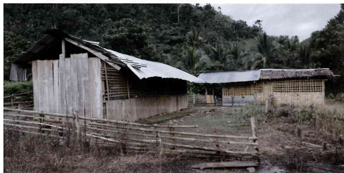
お父さんたちによって新たに増築された2教室 (アルサビ)