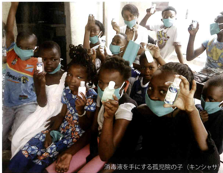
消毒液を手にする孤児院の子（キンシャサ）