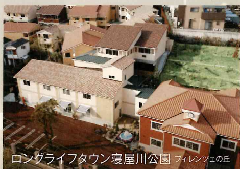
ロングライフタウン 寝屋川公園 フィレンツェの丘