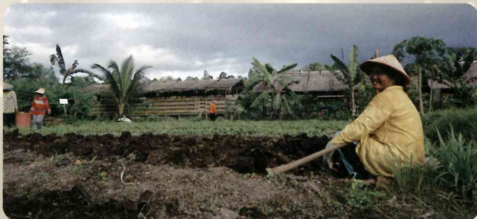
農業トレーニング (インドネシア・シブルット島)

主な活動：①農家グループが栄養価の高い食物を持続的に生産していただけるようになるための農業トレーニングの実施。