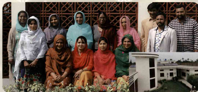
女性病院のスタッフと病院建物

パキスタンの新生児死亡率(生後28日未満の死亡率)は非常に高いので、クリニックで生まれた子どもたちとその母、家族の支援のために、子どもが1歳半になるまでスタッフが定期的に連絡をとり、状況を確認しています。