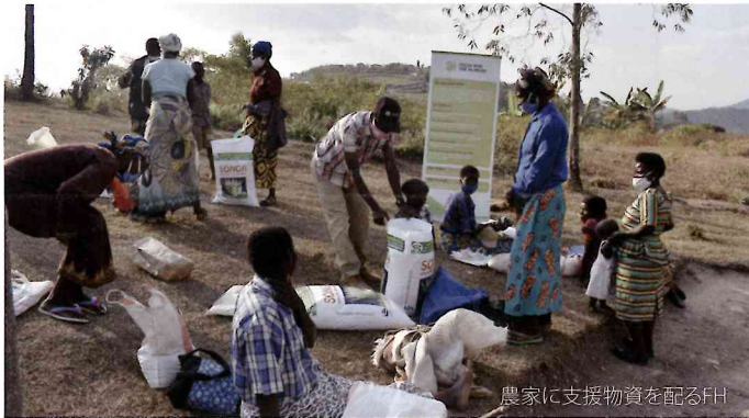
農家に支援物資を配るFH