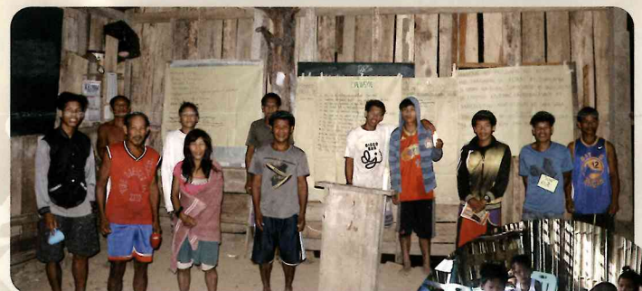
アルサビ村・リーダーシップ研修と学校教育支援⑥