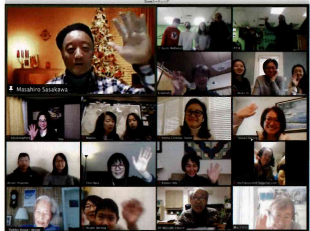
オンラインでつながるNYめぐみ教会のメンバーたち

守られています。教会堂に集まれる人数に厳しい制限がかけられ多くの方がネット礼拝を余儀なくされている中、日本とアメリカという距離の違いを感じさせない主にある交わりがZoomを通し与えられていることに感謝しています。