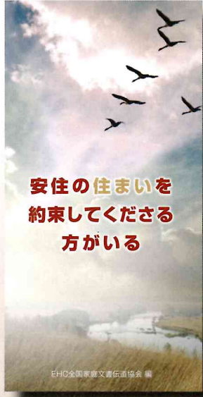
6面フルカラー 50枚入 750円+税 文/EHC編 (44545)