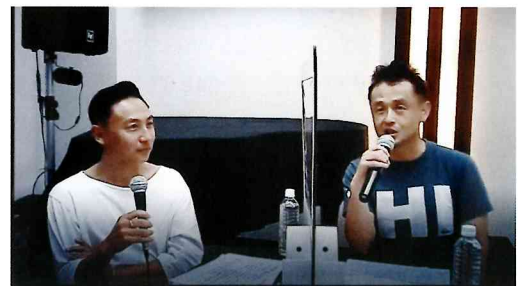
いのちのことは社チャペルで行われた講演がウェブを通して全国へライブ配信された

参加者からは、「とても励まされた。改めて、CS教師として神様から召しを頂いたように感じた」「質問コーナーが役に立った」「海外在住のため、またオンラインで開催してほしい」などの声が寄せられました。今後もCS教師のため、子ども伝道のための有用な学びの場を提供できればと願っています。