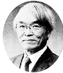
東京基督教大学学長