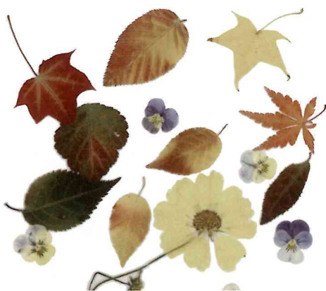
パートナーの方が押し花を送って下さいました。

ご献金の際に、払込取扱票等にコメントを添えてくださる方がいらっしや、スタッフはとても励まされています。いくつか紹介させていただきます。