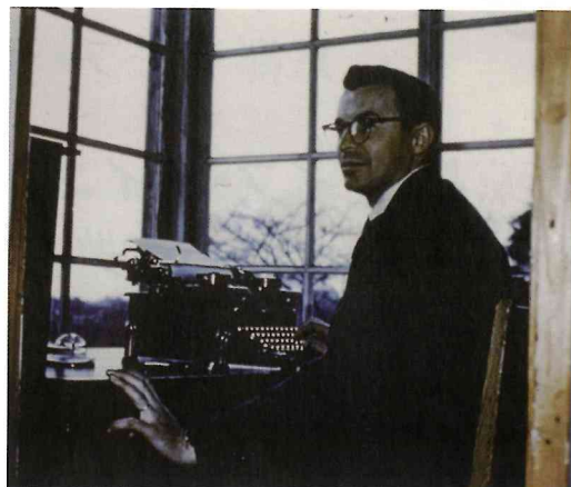
アーサー・シーリー宣教師

感謝すべきことに、それ以来、この「イエス・キリストを主として一つになる」という霊的ムード、霊的スピリットは、現在に至るまでPBAに流れている。