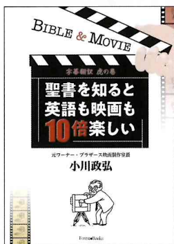
『聖書を知ると英語も映画も10倍楽しい』

を吸収することに努めたと振り返りました。また現在、元の職場にはクリスチャンの字幕翻訳者がいないため、ぜひクリスチャンがこの世界を目指してほしいと訴えました。講演の1時間が短く感じるほどの濃い内容で、アンケートでは「もっと聞きたい」という声が数多く寄せられました。50名