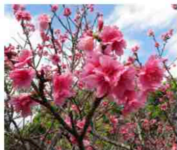
カンヒザクラ(2月3日 市民の森にて)

そのような長期的なビジョンに向かって進むための後任牧師家族を祈り求め始めることになりました。ぜひお祈りください。島には高校が3校あり、八重山の離島からも集まって来ます。3校とも教会から徒歩の距離です。光る海教会が日本各地にキリスト信仰者の若者を送り出す教会として整えられていくなればこれほどの幸い、光栄はありません。後任牧師が与えられ、主の宣教の御業に用いられるにふさわしく整えられていきたいと祈っています。お祈りください。