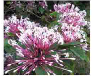
クレロデンドラム・クアドリロクラレ

ある者は戦車を ある者は馬を求め、 しかし私たちは 私たちの神 主の御名を呼び求める。 詩篇 20篇 7節